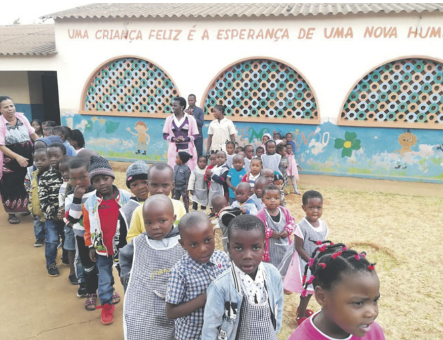
Alumnos de una escuela teresiana de Mozambique