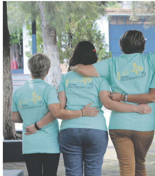
Un grupo de hermanas en América