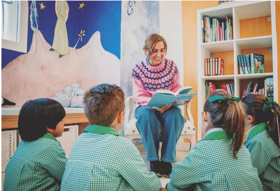
Estudiantes de uno de los centros de la Fundación Teresiana en España

cultura que supere la violencia, la desigualdad y la indiferencia.