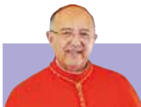
Pedro Barreto Jimeno, SJ CARDENAL ARZOBISPO DE HUANCAYO (PERÚ) Y PRESIDENTE DE LA CEAMA