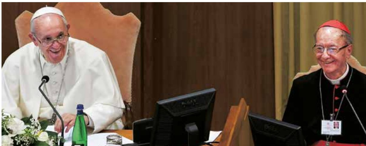
Francisco, con el cardenal Hummes, durante una de las sesiones del Sínodo de la Amazonía

indígenas, el episcopado y el clero, la vida consagrada, los agentes pastorales laicos, la Curia romana, las redes católicas internacionales, los formadores de opinión y los medios de comunicación.