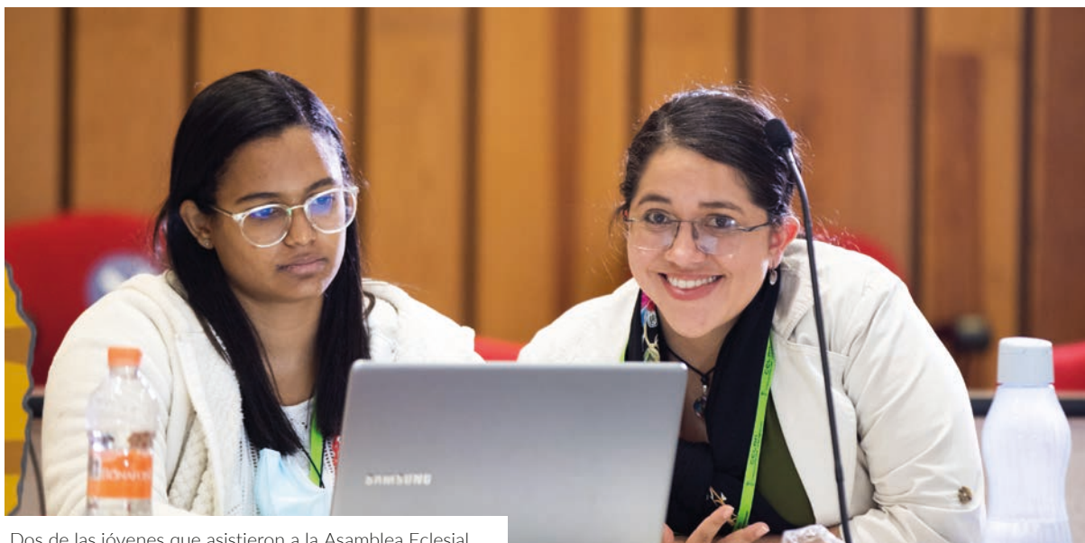
Dos de las jóvenes que asistieron a la Asamblea Eclesial

¿Se detuvo el reloj? “No se pueden dar directivas generales para una organización del Pueblo de Dios al interno de su vida pública”, responde el Papa. Por ello, “a inculturación es un proceso que los pastores estamos llamados a estimular alentando a la gente a vivir su fe en donde está y con quién está”. Eso sí, es un trabajo de artesanos y el camino empieza. ●