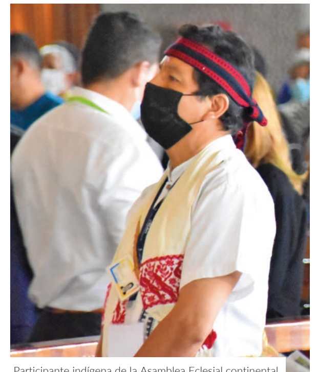
Participante indígena de la Asamblea Eclesial continental

Por tanto, “mientras el laico conciba su misión solamente al interior de la Iglesia y este reduzca su participación al culto-sacramental y se sienta subordinado a las decisiones y a lo que el sacerdote vaya indicando, no irá asumiendo con madurez su →