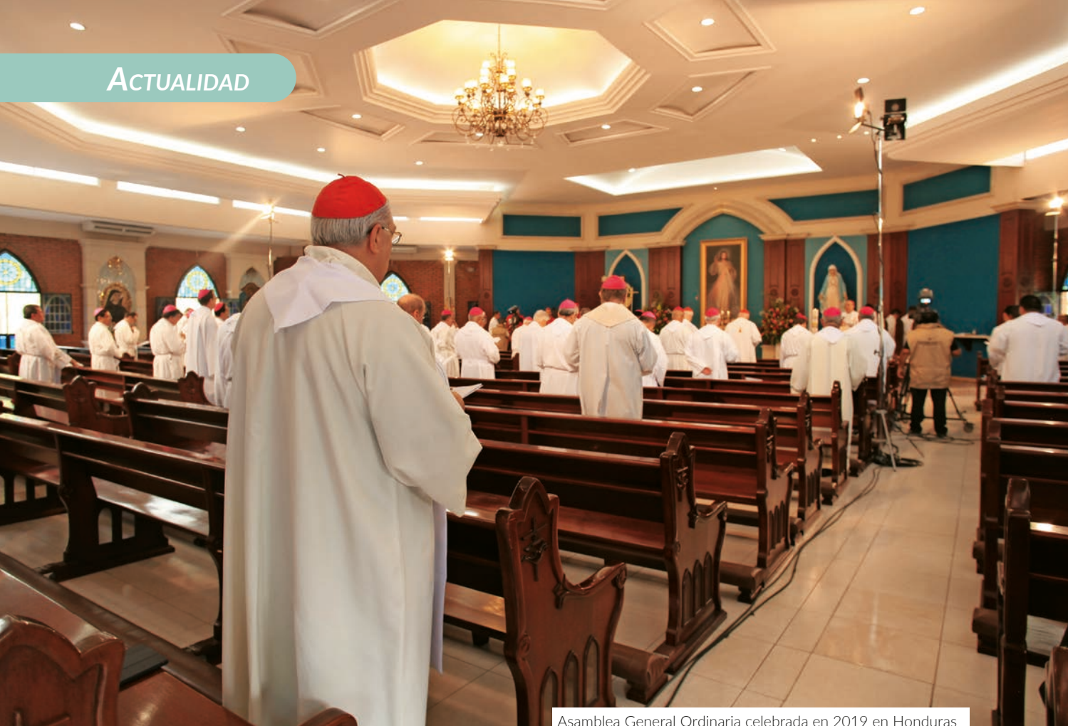
Asamblea General Ordinaria celebrada en 2019 en Honduras