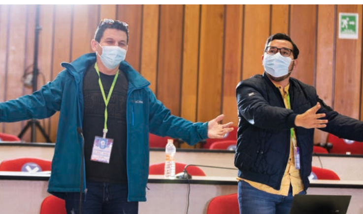
Varios de los laicos que hicieron parte de la Asamblea Eclesial de América Latina y el Caribe celebrada en noviembre de 2021

pero “pareciera que el reloj se ha parado. Mirar al Pueblo de Dios, es recordar que todos ingresamos a la Iglesia como laicos”. Por ello, “el Santo Pueblo fiel de Dios es al que como pastores estamos invitados a mirar, proteger, acompañar, sostener y servir. Un padre no se entiende a sí mismo sin sus hijos. Puede ser un muy buen trabajador, profesional, esposo, amigo, pero lo que lo hace padre tiene rostro: son sus hijos. Lo mismo sucede con nosotros, somos pastores. Un pastor no se concibe sin un rebaño al que está llamado a servir. El pastor, es pastor de un pueblo, y al pueblo se lo sirve desde dentro”. ●