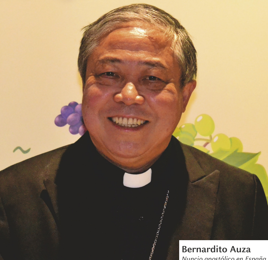
Bernardito Auza Nuncio apostólico en España