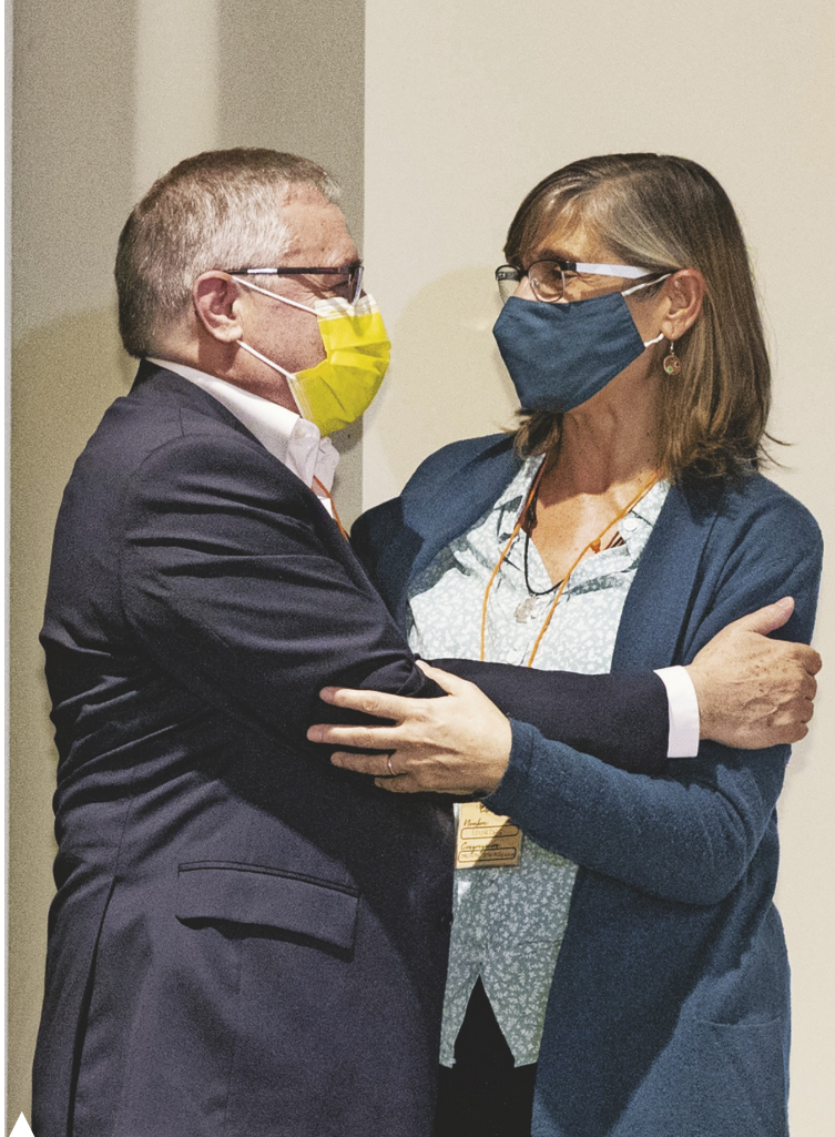
El presidente y la vicepresidenta se abrazan al ser elegidos por la Asamblea General

LP: Hoy un gran desafío es la igualdad. En la CONFER no hemos experimentado en ningún momento que haya un clima interno patriarcal y me alegro y lo agradezco. Quizá a nivel eclesial es hoy más desafío. Está en la mano de la Vida Religiosa y en la de toda la Iglesia ir dando pasos. No es fácil, porque en esta diversidad eclesial hay quien no ve