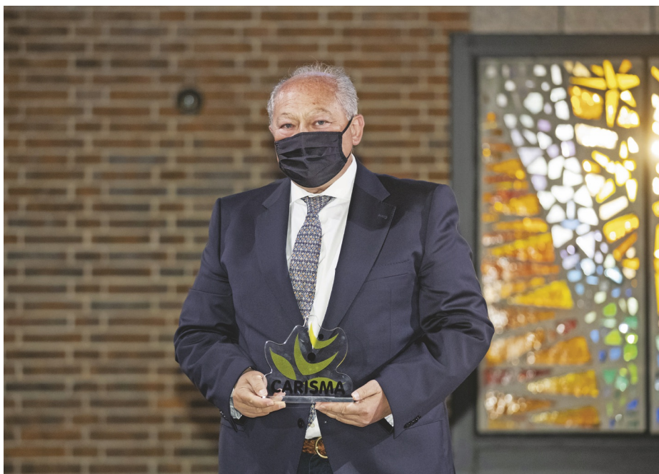
FUNDACIÓN MADRINA · PREMIO JUSTICIA Y SOLIDARIDAD

la Fundación Madrina. Una obra de amor por la infancia y la maternidad vulnerable. Una institución pequeña pero que hace mucho”. El presidente muestra también su alegría por estar al lado de los capellanes que acompañaron a los enfermos del COVID. “Ellos perdieron el miedo porque hay mucho amor por los demás en sus corazones, que eso nos lo da Dios”, resalta.