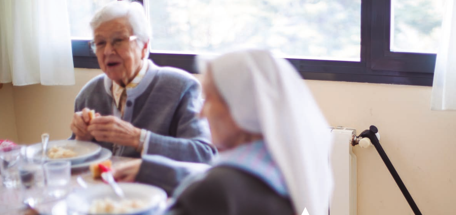
Las consagradas, durante una comida

lizarnos, porque ellos realmente confían en Dios”, dice. Ahora se entretiene con los libros y rezando. “A mí me gusta leer y eso me sirve de relajación, pero también pienso mucho en la gente que sufre y, por eso, cada día rezo más”, señala con una sonrisa que desborda. Sobre el futuro de las hermanas jóvenes cuando sean ellas las que necesiten atención también se atreve: “Las congregaciones tenemos que vivir en unidad y ayudarnos”.