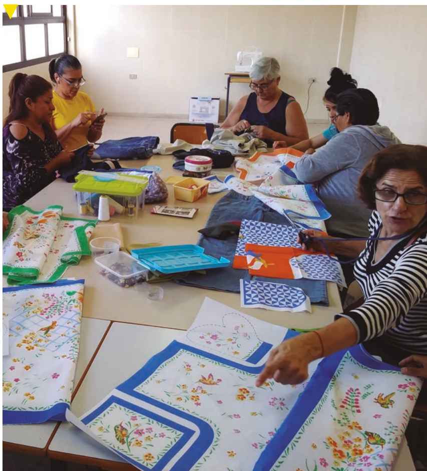
Uno de los talleres con mujeres de la Fundación

Lo más bonito de todo son los lazos que se establecen entre nosotros, el aprendizaje mutuo, el enriquecimiento continuo, no solo en lo intelectual o en las herramientas necesarias para poder adquirir un puesto de trabajo, es la riqueza de la calidez humana, los ejemplos de resiliencia y bondad que unos aprendemos de otros. Lo más bonito de esta delegación de Tenerife es que es una casa donde todo el que viene encuentra la puerta abierta y una mano, un hombro, una sonrisa, la riqueza de estos proyectos reside en el corazón de las personas y la providencia. 😊