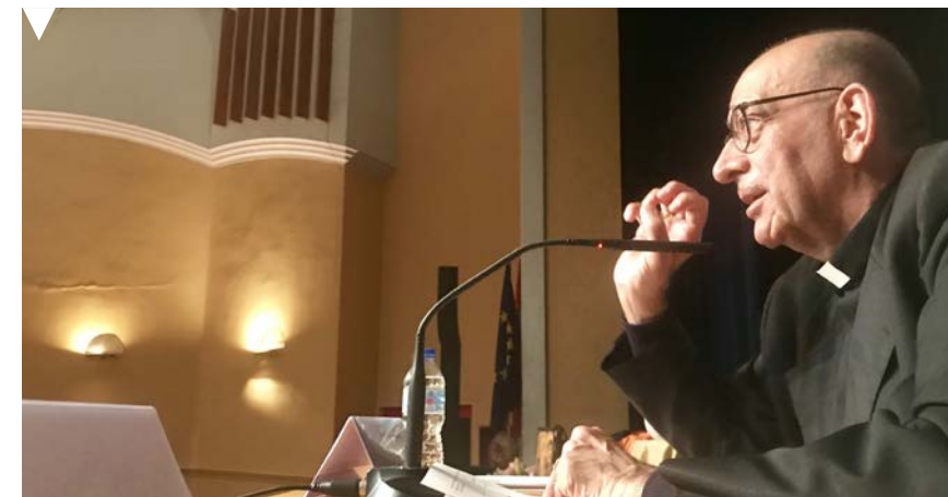
El purpurado, durante su alocución

En este punto, el purpurado aprovechó para hacer una defensa de Francisco: "Este Papa no tiene nada de tonto. Los tontos somos nosotros que no nos enteramos y cuando él apunta las reformas que necesitamos, nos quedamos mirando al dedo y no al futuro". 😊