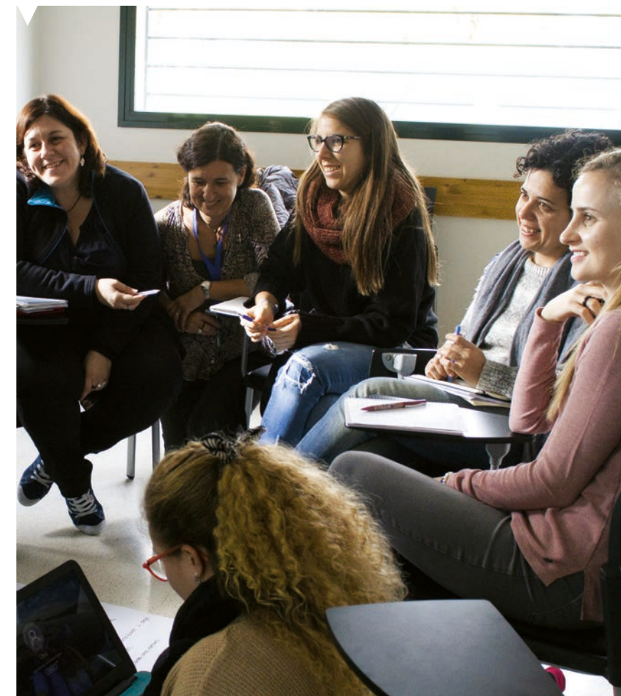
Jóvenes voluntarias de Entreculturas

Un reto es que nuestro voluntariado además de realizar una colaboración de calidad lo realice desde la calidez. Para ello las entidades sociales, especialmente las vinculadas a la Iglesia, debemos contar con itinerarios educativos de las personas voluntarias que profundicen en los procesos de selección, formación, evaluación y de acompañamiento. 😊