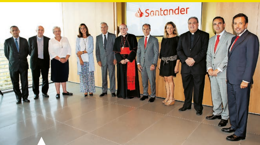
El cardenal Osoro asistió al acto de entrega de los cheques en la sede de Banco Santander

B anco Santander, a través del Fondo Santander Responsabilidad Solidario, ha entregado 633.000 euros a la CONFER para proyectos dirigidos a la formación de aquellos colectivos más vulnerables en situación de riesgo o exclusión social y en proyectos de formación orientados al empleo. En concreto, 15 proyectos de institutos religiosos han sido reconocidos con una cuarta parte del montante de 2,6 millones de euros que la entidad a repartido entre Cáritas, Manos Unidas y CONFER. En total, 30.000 personas se beneficiarán de la cantidad más elevada conseguida por una entidad financiera española a través de un fondo de inversión solidario.