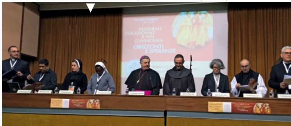
Monseñor Carballo preside la mesa del Congreso de PJV en Roma

La Vida Religiosa ha dado muchos pasos en este sentido pero debe avanzar aún más. No es solo tarea de quienes se dedican de una manera más directa de la pastoral con jóvenes y adolescentes, es una invitación y desafío a todas nuestras instituciones, comunidades y diócesis: estamos llamados a una verdadera conversión pastoral. 😊