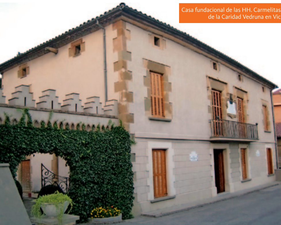
Casa fundacional de las HH. Carmelitas de la Caridad Vedruna en Vic

» manifestar que en toda circunstancia y lugar ella quería recorrer la senda de la dignidad, hecha de abandono en Dios, de ofrenda de la vida.