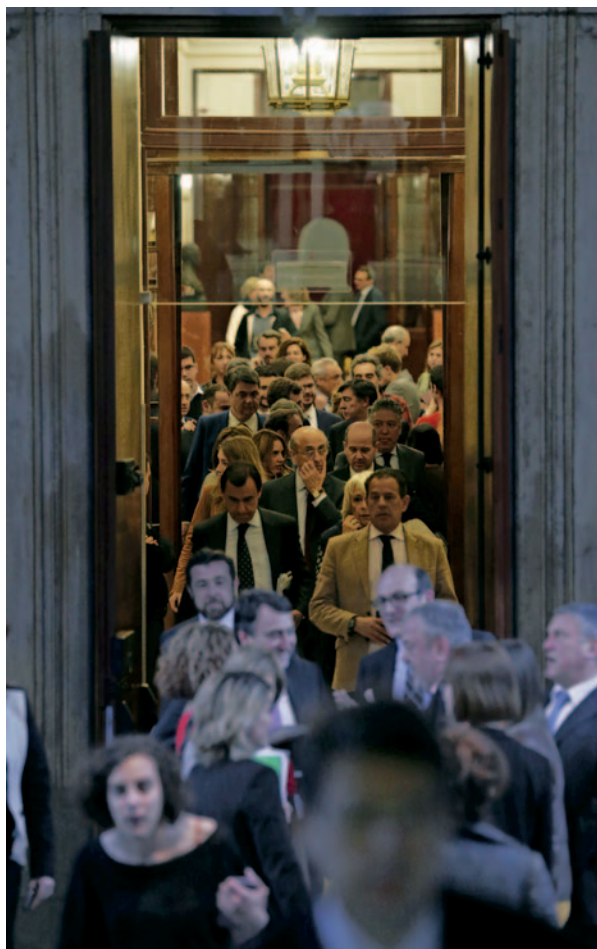
Los diputados abandonan el Pleno del Congreso

“Estamos en un proceso natural que evidencia el fracaso del sistema”