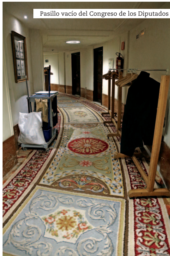
Pasillo vacío del Congreso de los Diputados

Sobre la falta de entendimiento, Honorato apunta que “en legislaturas ‘blandas’, en las que no tuviéramos que enfrentarnos a una remodelación del Estado, haciéndolo más transparente y democrático, quizás podríamos encontrarnos la mayoría de las fuerzas políticas, pero ahora toca trabajar en los pilares económicos para poder garantizar los derechos y el Estado de Bienestar, poniendo en el centro de la política a las personas”. Por su parte, Pericay subraya que “Ciudadanos ha defendido en reiteradas ocasiones echar la vista atrás y mirarnos en la Transición, tal vez porque somos un partido de centro –como aquella UCD de Adolfo Suárez – y porque, en aquel entonces, todas las fuerzas políticas tuvieron la generosidad de aparcar sus diferencias para poner en valor lo que les unía”. ●