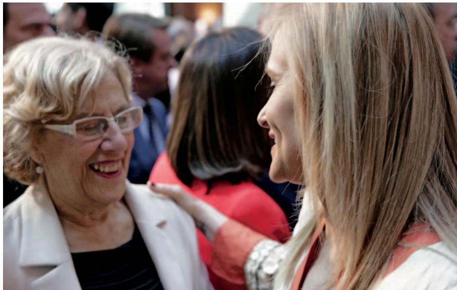
Arriba, Carmena y Cifuentes. Abajo, Susana Díaz. A la derecha, Sáenz de Santamaría

Lo que estas elecciones fallidas nos muestran es una sociedad fallida. Yo lo llamo “demogresca”, que es una sociedad incapaz de ponerse de acuerdo en nada y está repre-