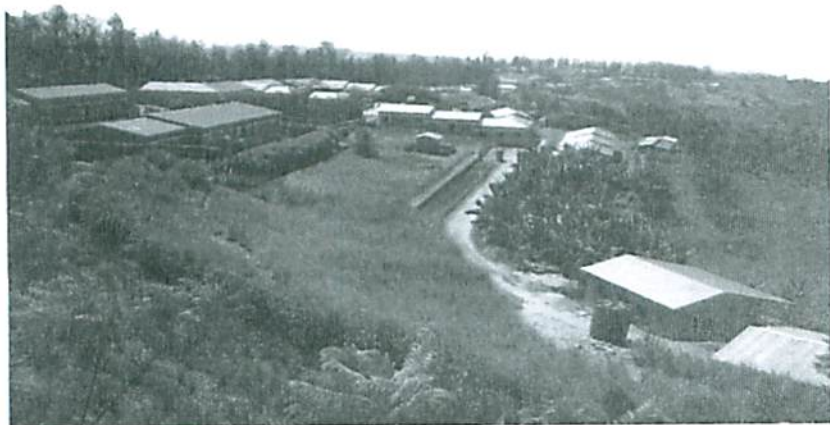
Panorámica del Campus

La Fundación ISIDRO UZKUDUN piensa que, una vez acabadas las obras de infraestructura, deberá centrarse en su objetivo fundamental: ayudar a aquellas personas, estudiantes y docentes, más necesitadas económicamente, además de seguir contribuyendo a los gastos de mantenimiento del Campus, con la finalidad de obtener un óptimo funcionamiento del Colegio San Ignacio.