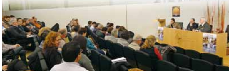
Sala d'actes de la Casa de l'Església del Bisbat de Sant Feliu

Avui, a deu anys vista, tothom veu tancat el procés de constitució de les institucions i els organismes dels nous bisbats. Els primers anys van