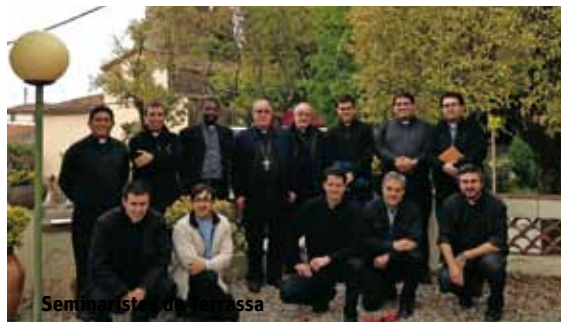
Seminari pastoral de Terrassa