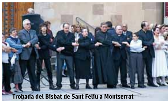
Trobada del Bisbat de Sant Feliu a Montserrat