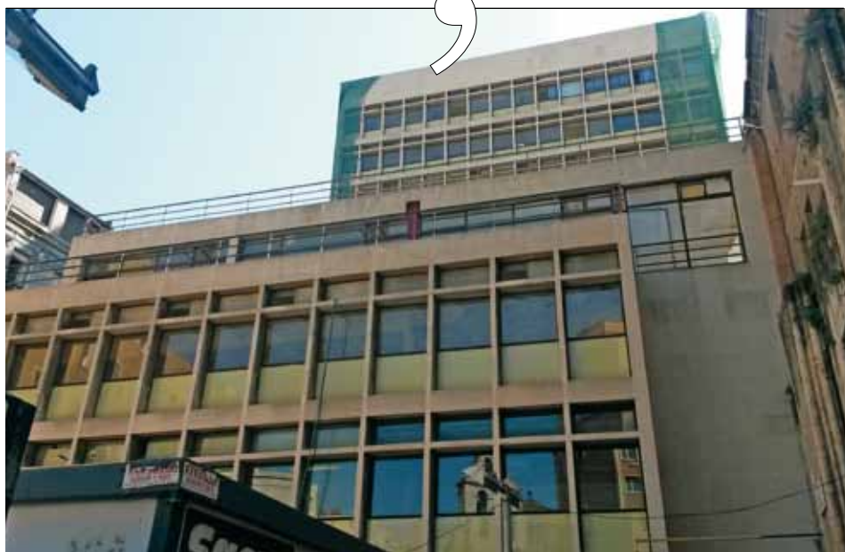
L'edifici de Rivadeneyra, actualment en obres

Una altra complicació han estat les propietats de la mitra de les quals feien ús les parròquies. Els diversos criteris d'interpretació els va acabar concretant Roma, dient que