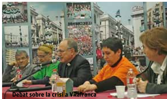
Debat sobre la crisi a Vilafranca