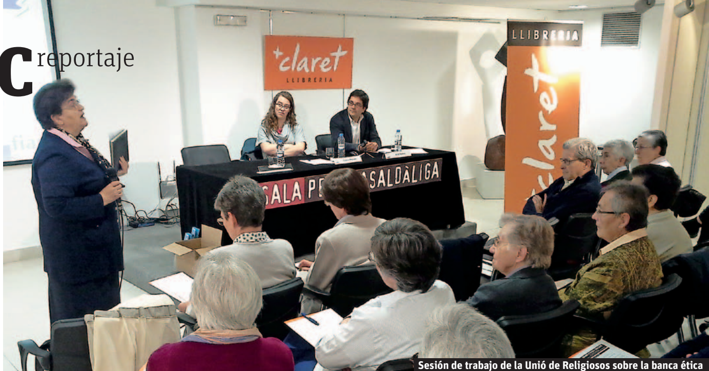
Sesión de trabajo de la Unió de Religiosos sobre la banca ética