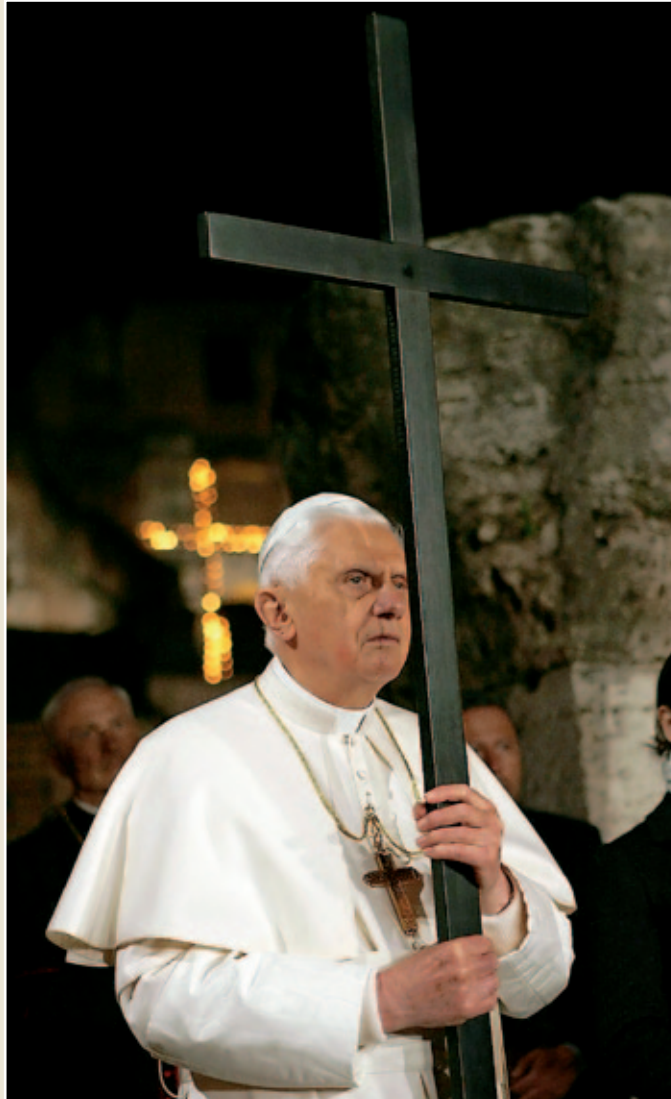
Abril fue muy complicado para Benedicto XVI. Tras los intentos de implicarle en los casos de abusos, el Papa recibió el apoyo de los fieles y obispos, y consiguió resarcirse en su viaje a Malta.

Benedicto XVI cerró el mes con un viaje apostólico a Malta, donde se reunió y lloró con las víctimas de los abusos. Allí, en medio de una sociedad mayo-