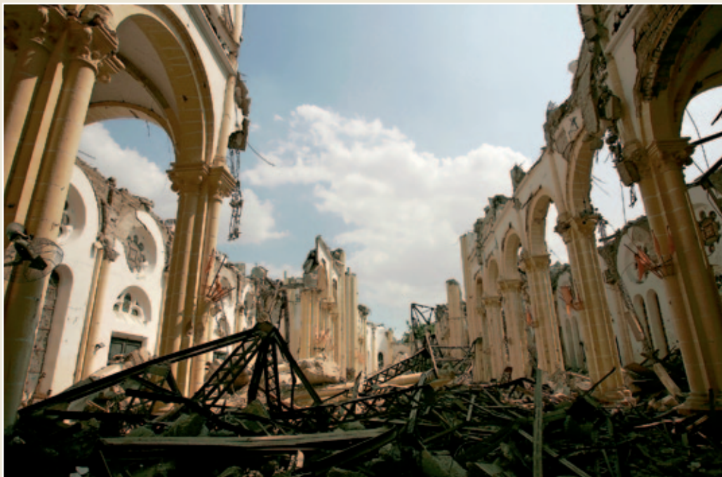
El 12 de enero de 2010, un terremoto devastó Haití. Se llevó por delante a miles de personas y dejó al país, uno de los más pobres del planeta, totalmente destruido. La tragedia golpeó con fuerza la conciencia de ciudadanos de todos los continentes. Los primeros meses, la solidaridad desbordó.

Concluye el año 2010. Año de luces y sombras. El de los terremotos de Haití y Chile. El de los mineros rescatados, también en Chile. El que sacó a la luz los casos de abusos sexuales y el que vio cómo el Papa abordaba con determinación y sin titubeos el problema. El año en que se acrecentó la crisis y con ella sus consecuencias y, por ende, la labor de la Iglesia. El año del Mundial de Fútbol, pero el de la persecución a los cristianos en Oriente Medio. También el de los Bicentenarios de la Independencia en Latinoamérica, y el de la inestabilidad en la zona. El Año Santo Compostelano, que no volverá hasta dentro de 11. Cuando el Papa visitó Santiago y Barcelona: donde fue peregrino y dedicó la Sagrada Familia.