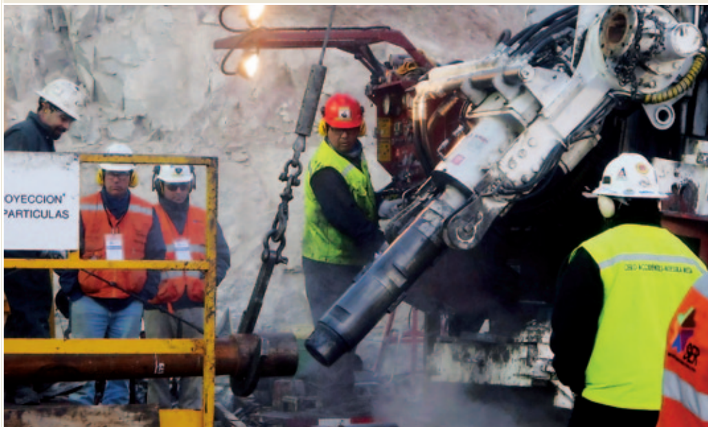
El milagro fue posible. La esperanza se materializó. La técnica permitió a los mineros atrapados en una mina chilena salir a la luz tras dos meses de encierro. Todas las miradas del planeta se dirigieron hasta allí para sonreír y alegrarse con ellos.

La publicación de la Exhortación Verbum Domini para entender y vivir la Palabra o el Consistorio en el que se hizo cardenal, entre otros, al arzobispo emérito castrense, José Manuel Estepa tuvieron relevancia en el Vaticano y en el mundo. También la publicación del libro Luz del Mundo , una entrevista de Peter Seewald al Papa, donde, entre otras cosas,