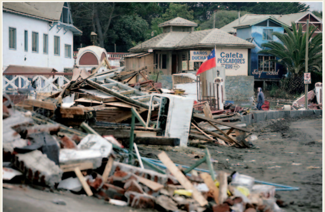
Las catástrofes naturales volvieron a golpear a América Latina. Esta vez, le tocó padecer a Chile. Un terremoto de 8,8 grados en la escala Richter que, aunque tuvo consecuencias devastadoras, no fue tan grave como el acaecido en Haití unos días antes.

Cuando todavía llegaban informaciones desde Haití, un nuevo terremoto golpeó América Latina. Esta vez, le tocó a Chile. El seísmo alcanzó en algunos lugares los 8,8 grados de intensidad en la escala